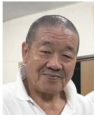
プロレスラー 藤原喜明

1973年 京都府立医科大学卒業 第一外科入局 1977年 秋田大学医学部外科 1982年 米国テキサス大学 ヒューストン校留学 1995年 京都府立医科大学 第一外科助教授 2000年 癌研究会附属病院 消化器外科 2015年 がん研究会有明病院 病院長 2018年 がん研究会有明病院 名誉院長 専門は消化器癌、特に胃癌